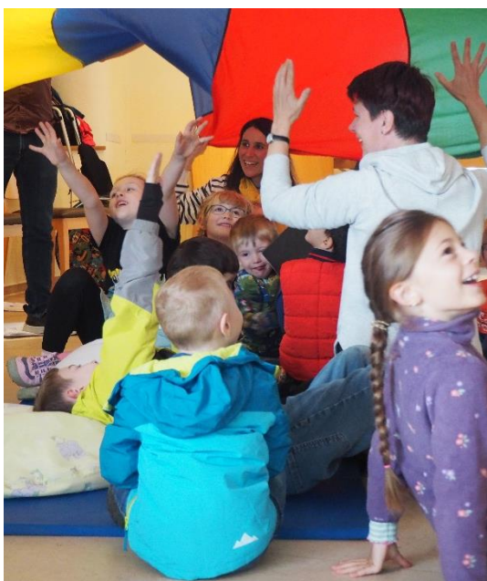
Bild 4: Kinder und Frühförderinnen sitzen unter dem sich hebenden und senkenden Schwungtuch.

Die Zeit ohne die Eltern war ein großer Spaß! Aber das absolute Highlight war der Treckerführerschein! Jedes Kind durfte eine große Runde auf dem Gelände drehen.