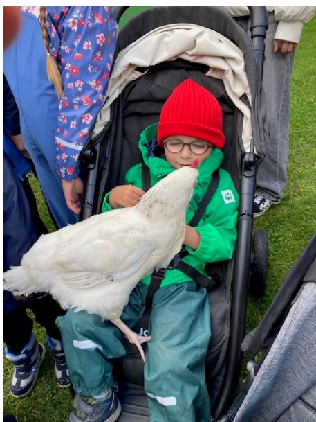
Bild 2: Ein kleiner Junge sitzt im Buggy, hat ein Huhn auf den Beinen sitzen und betrachtet es interessiert.