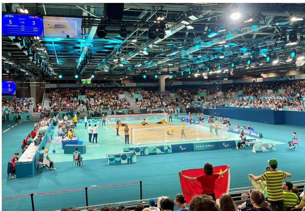
(Bild 4: Das Goalballfeld in der „Arena Paris Sud 6“, im Vordergrund chinesische und brasilianische Fans mit Flaggen)

Spannend waren dann die Goalballwettbewerbe! Wir waren bei den Teamwettbewerben der Männer und der Frauen um Bronze. Und da einige der Schüler*innen aktiv Goalball spielen, waren diese Wettbewerbe besonders interessant. Beide Male trat Brasilien gegen China an und wir saßen schräg hinter dem brasilianischen Fanblock. Stimmung pur, die Metalltribüne bebte! Die brasilianischen Männer gewannen knapp mit 5:3. Das Spiel der Frauen ging eindeutiger aus: Die chinesischen Frauen gewannen zu 0, was unsere Expert*innen sehr stark fanden, da „eigentlich einer immer reingeht“.